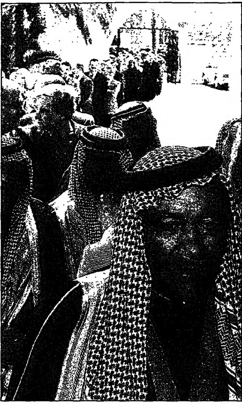
زعماء القبائل الأردنية يصفون لثلاثة أعضاء الحكومة الجديدة في عمان

عمان - القدس العربي - ليس سرا ان في عمان ان احد اسباب الرحيل المفاجيء للحكومة عبد الكريم الكباريتي هو خصوصيتها مع ولي العهد الامير حسن، وان كانت بعض الاسباب السائدة كانت في خروج كباريتي من دائرة الكباريتي عن الطريقة التي دخل فيها تجربة الحكم. وليس سرا في تقليد الحكم في الأردن ان الحكومة التي تتجاوز ملك الامير تتخرج من الساحة بسرعة. فملك حسين قال بوضوح للوزير في الداخل والخارج انه وشقيقه شخص واحد وان مرجعية الامير هي بالضرورة مرجعية الملك. والخبر هو الامير، لا بعد سرا في عمان الحديث الهام بين السياسي من تصاعد جبهة اليمين الكباريتي التي حدثت في وقتها في بعض التفرقات مثيرة له بإجراء تصديقات مسورة تشبه مصليات مؤسسة ولي العهد التي أكد ملك نفسه انها تشترك في المرجعية. وليس سرا ان الاقتراحات من هذا النوع كان يتداولها يسمت سياسيون محلو مع الامير حسن، وخبروا طبيعة النور الذي يقوم به في خدمة الدولة، لكن لحد لم يكن يستطيع لجاهرة بهذه الاقتراحات او حتى وضعها على طاولة التحليل.